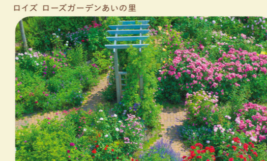
ロイズ ローズガーデンあいの里

ロイズ本社ビル敷地内にある 「ロイズ ローズガーデンあいの里」をはじめ、 ロイズ上江別店、ロイズタウン工場直売店前にも 美しいローズガーデンが広がっています。 ※見頃は6月下旬～8月上旬頃。