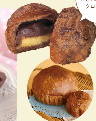
ジャンボサイズ(左)は 通常サイズ(右)の約4倍!