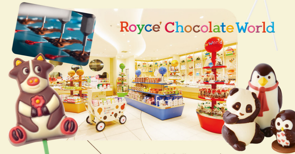
Royce' Chocolate World

北海道の空の玄関口・新千歳空港3Fに、工場、ミュージアム、 ショップを併設したチョコレートのワンダーランド、 ロイズ チョコレートワールドがオープン。 カラフルで楽しいオリジナルチョコレートがいっぱい!