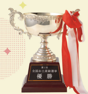
番組から贈られたトロフィー

※2位と4位は冬期間の季節限定商品 ※ロイズ通信販売2022年1月-12月までの 売上をもとにしたランキングです。