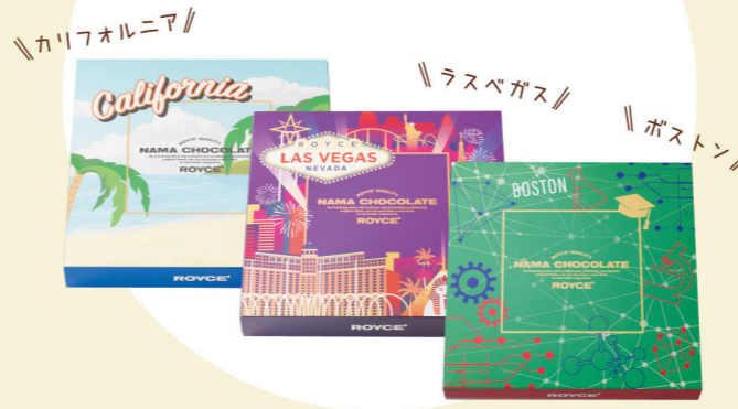
カリフォルニア // ラスベガス // ボストン